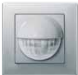
Rilevatore di presenza KNX a incasso, design M-Plan, alluminio

Se non è possibile il montaggio a soffitto è disponibile la versione da incasso KNX ARGUS 180/2.20 m con due sensori.