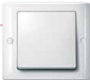
Merten Aquadesign, bianco polare

La gamma Merten Aquadesign è la soluzione ideale in caso di esposizione degli interruttori a umidità, vento e pioggia: negli spogliatoi e nelle docce, nei