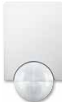
Rilevatore di movimento per esterni, bianco polare

Con i sensori di movimento per interni Schneider Electric è possibile controllare l'illuminazione di corridoi, scale, uffici, toilette, aree di accesso al seminterrato o locali poco utilizzati: la luce si accende automaticamente quando una persona entra nel raggio d'azione del rilevatore.