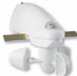
Stazione metereologica KNX basic

Il fattore comodità fa guadagnare a Schneider Electric voti da prima della classe: la stazione metereologica KNX Basic abbassa le veneziane orientandole nella giusta posizione, proteggendo insegnante e studenti dalla luce solare eccessiva.