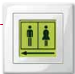
Segnalazione luminosa a LED, design M-Smart, bianco polare

Dove si trovano le toilette? Come si raggiungono le uscite di emergenza e le scale? Occorre avere indicazioni precise e sempre disponibili. Orientarsi all'interno di un edificio scolastico non sarà