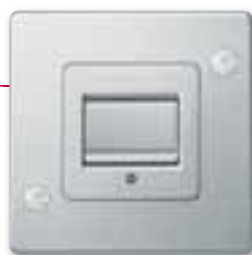
Merten Antisabotaggio, interruttore