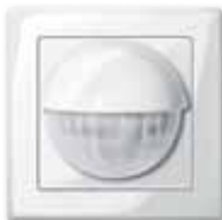
Rilevatore di presenza KNX a incasso, design M-Smart, bianco polare