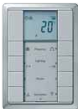
Pulsante multifunzione quadruplo, con regolatore di temperatura ambiente, design Artec, alluminio

Grazie al tasto multifunzione Schneider Electric con regolatore di temperatura ambiente integrato l'aula magna e qualsiasi altro locale della scuola potrà essere riscaldato o raffreddato in base alle vostre esigenze, garantendo sempre un livello di comfort ottimale. Tutto questo con notevole precisione, grazie ad un dispositivo temporizzatore.