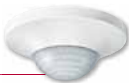
Rilevatore di presenza, bianco polare

Con i rilevatori di presenza è possibile risparmiare sui costi di elettricità e riscaldamento. I corridoi, le aule, la palestra e gli spogliatoi vengono illuminati automaticamente non appena una persona entra nel raggio d'azione del rivelatore che può eventualmente comandare lo spegnimento della luce quando il locale risulta nuovamente libero. Se l'impianto è dotato di variatori dimmer la regolazione delle luci verrà impostata automaticamente in base alla luce solare e alla luminosità. In questo modo è possibile monitorare costantemente anche i lunghi corridoi, controllando in modo intelligente la loro illuminazione. La luce può essere accesa e spenta anche manualmente in qualsiasi momento con un semplice pulsante.