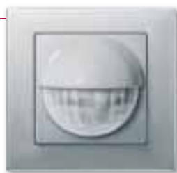
Rilevatore di movimento per interni, design M-Plan, alluminio