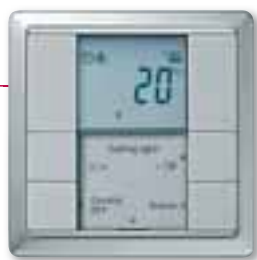
Pulsante multifunzione con regolatore di temperatura, design Artec, alluminio

D'ora in poi potrete prepararvi per la vostra lezione di ginnastica comodamente, senza lasciare lo spogliatoio. Mentre gli allievi si cambiano sarà sufficiente che premiate un solo tasto per creare condizioni ideali per l'attività sportiva. Se è in programma la lezione di pallacanestro le luci si accenderanno a 200 lux, livello di luminosità ideale per