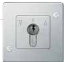
Merten Antisabotaggio, interruttore a chiave

Se desiderate regolare in modo preciso il livello di luminosità nella palestra durante la lezione non dovrete tornare nello spogliatoio. Sarà sufficiente utilizzare l'indistruttibile interruttore a chiave installabile all'interno della palestra.