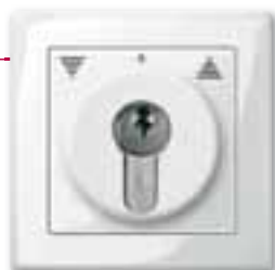
Interruttore a chiave per comando veneziane, design M-Smart, bianco polare