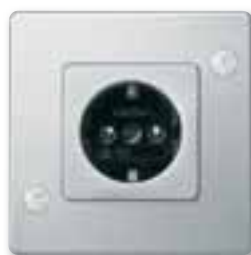
Merten Antisabotaggio, presa interruttore

Alcune situazioni, specialmente nei corridoi o in palestra, sono troppo stressanti per un impianto elettrico normale. Ed è qui che vengono in vostro aiuto le soluzioni speciali Schneider Electric. Se nella foga di una gara l'interruttore della luce della palestra viene colpito più della rete, o se orde di studenti utilizzano talvolta i corridoi e le aree esterne per le loro corse