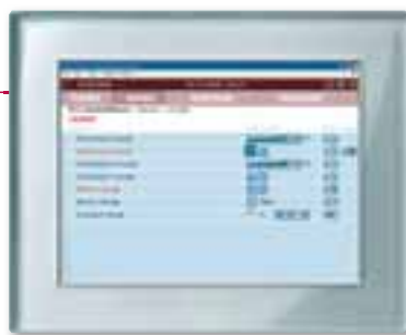
IP touch panel 10", design M-Plan cristallo

Il bidello è la persona preposta ad avere sempre tutto sotto controllo. In un edificio scolastico intelligente non avrà più bisogno di fare molti giri di ispezione. Sarà sufficiente dare un'occhiata allo schermo del touch panel IP 10" per vedere porte o finestre lasciate aperte o verificare la presenza di visitatori indesiderati nelle ore notturne. O controllare se vi sono luci e termosifoni accesi.